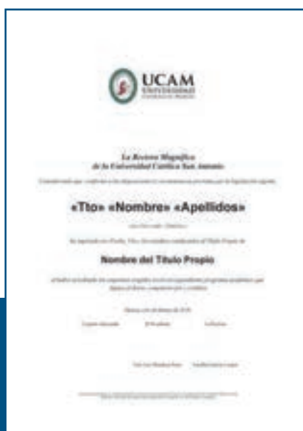
Máster de Logopedia en el Ámbito Educativo acreditado por la Universidad Católica San Antonio (UCAM)