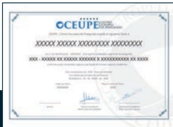
Máster de Logopedia en el Ámbito Educativo del Centro Europeo de Postgrado (CEUPE)